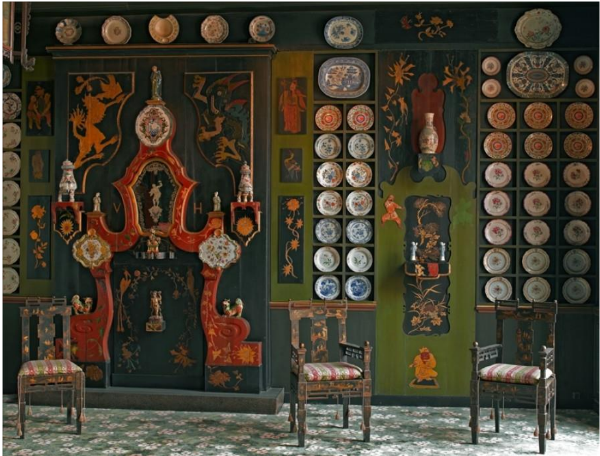
Charles Baudelaire, Parfum exotique , 1857

Quand, les deux yeux fermés, en un soir chaud d'automne, Je respire l'odeur de ton sein chaleureux, Je vois se dérouler des rivages heureux Qu'éblouissent les feux d'un soleil monotone ;