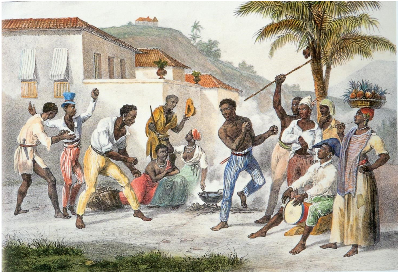
Jean-Baptiste DEBRET, 1834 Disponível sur : http://histgastronomia.blogspot.com [Consulté le 14 février 2022]