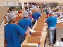
...INCLUÍDOS EM CESTAS BÁSICAS...