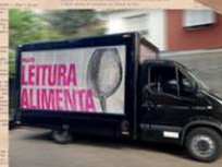
...TRANSPORTADOS PARA A CESTA NOBRE...