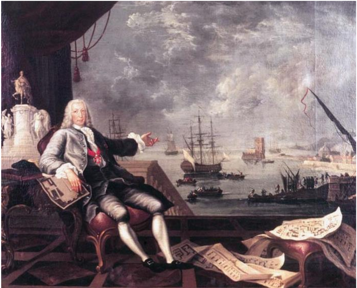
Louis Michel VAN LOO, óleo sobre tela, 1766, câmara municipal de Oeiras.