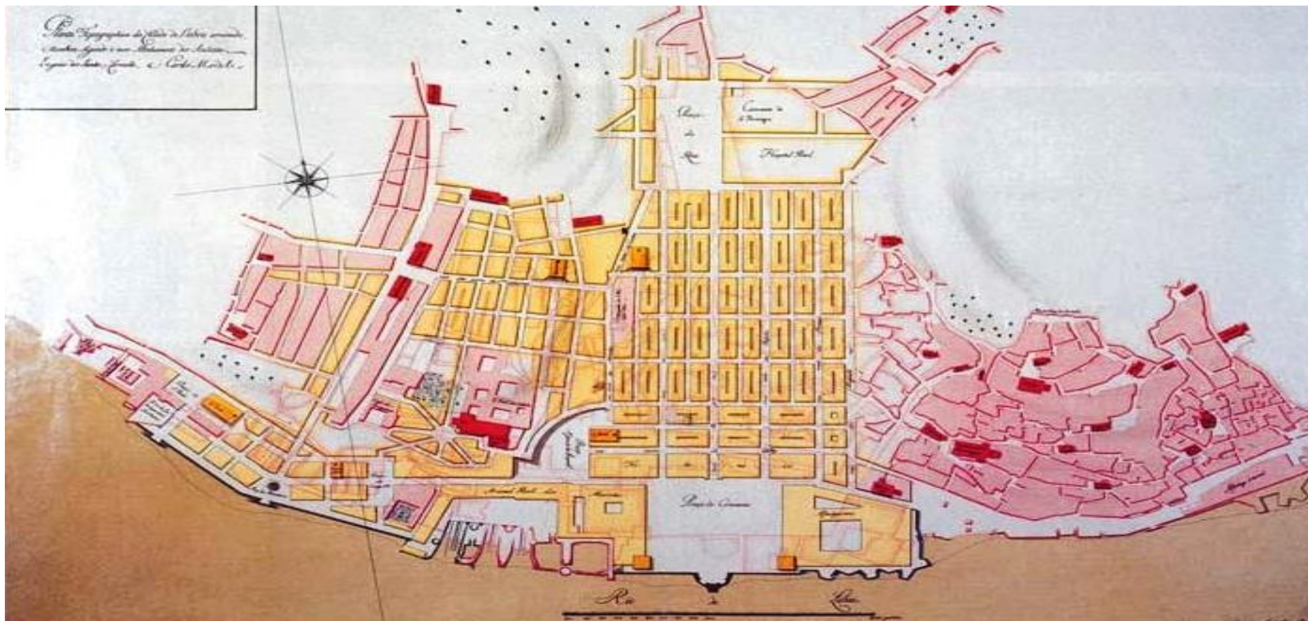
Planta do projeto de reconstrução de Lisboa, 1758. Litografia colorida. Museu de Lisboa.