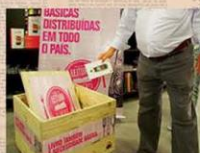
OS LIVROS SÃO DOADOS NAS LOJAS DA LIVRARIA DA VILA...

UMA FORMA INOVADORA DE LEVAR LIVROS QUE NÃO SÃO MAIS LIIDOS ÀS FAMÍLIAS QUE NÃO TÊM NADA PARA LER. AS PESSOAS DOARAM SEUS LIVROS. NÓS OS INCLUÍMOS EM CESTAS BÁSICAS.