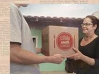
...E DISTRIBUÍDOS ÀS FAMÍLIAS DE BAIXA RENDA.