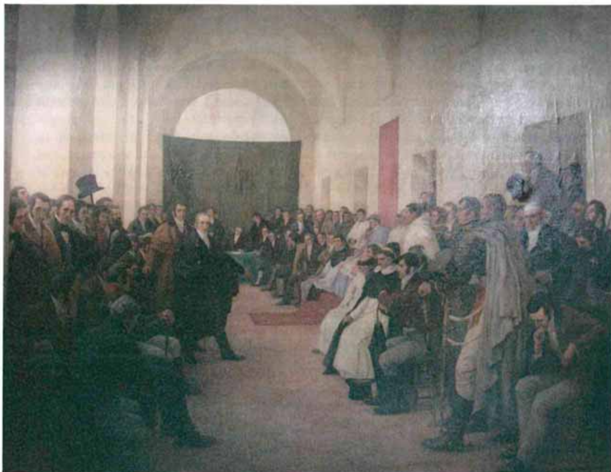
Pedro Subercaseaux Errázuriz, Cabildo abierto del 22 de Mayo de 1810. Proclamación en Buenos Aires de la Independencia del Virreinato del Río de la Plata.