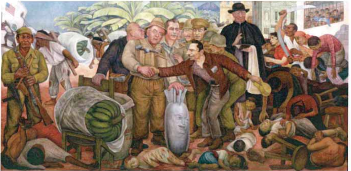
Diego Rivera, Gloriosa Victoria (1954)