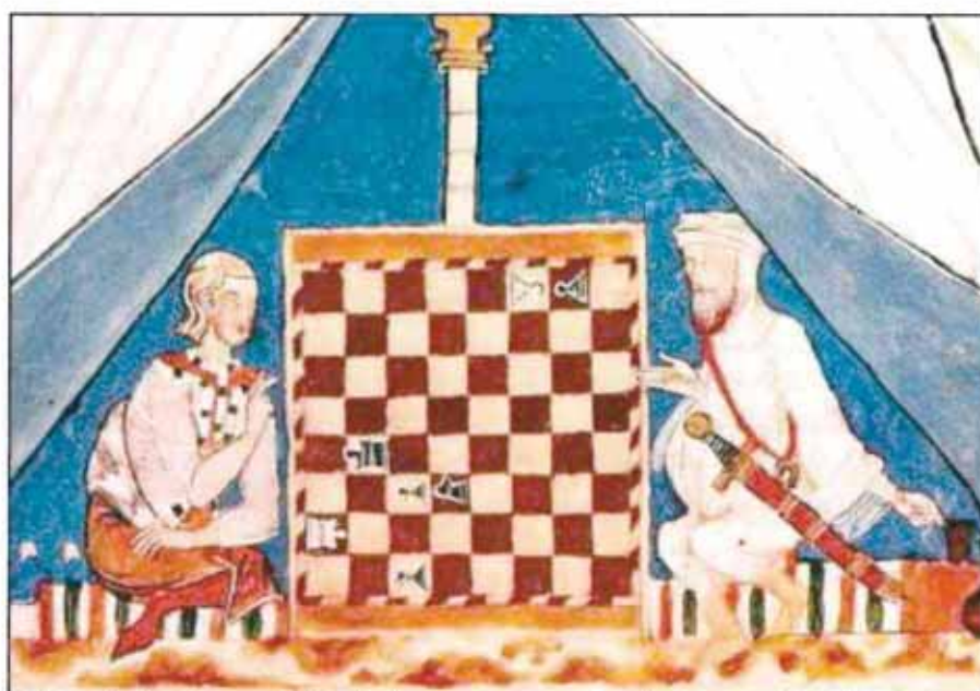
Libro de los juegos. Un cristiano y un musulmán juegan al ajedrez en una tienda (1238)