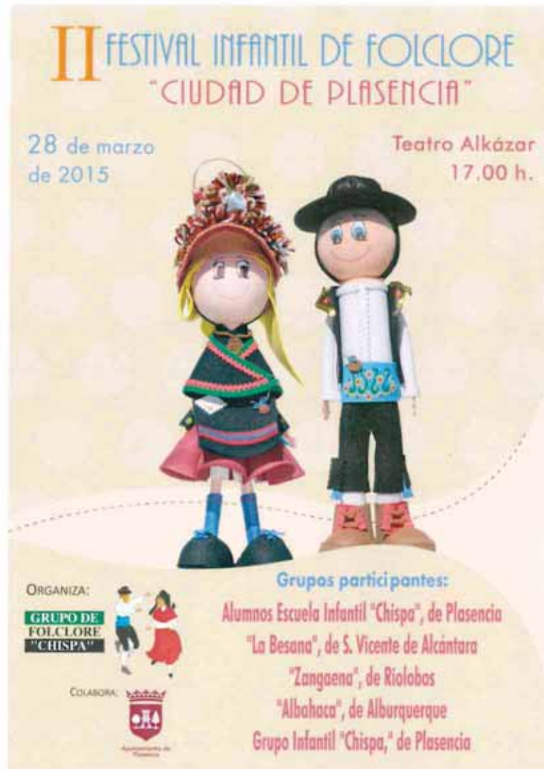
Festival de folklore infantil, Plasencia, 28 mars 2015.