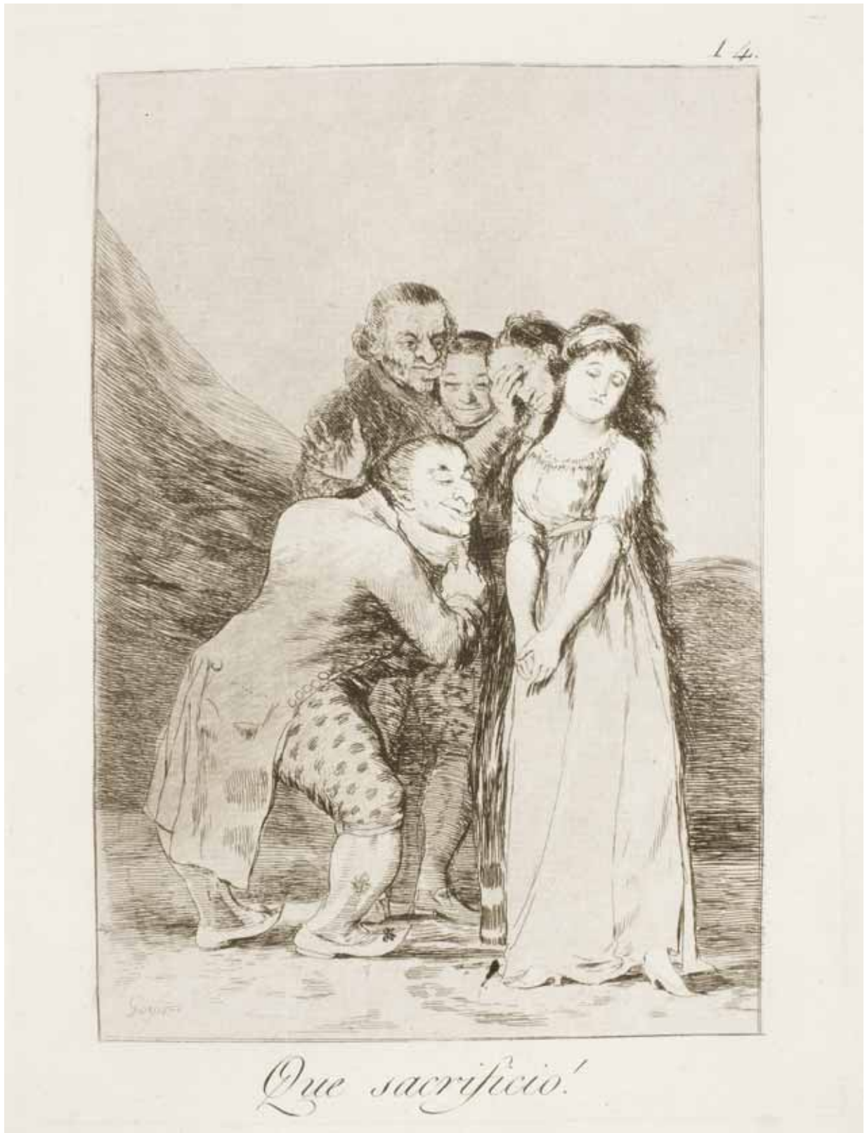
Francisco de GOYA Y LUCIENTES, Los Caprichos , “¡Qué sacrificio!”.