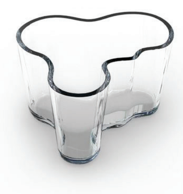
AALTO Alvar, vase Aalto, 1937, verre.