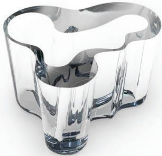
CTVRTNIK Jan, vase Droog Aalto, 2007, verre.