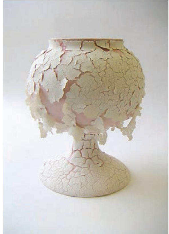
VAN ESSEN Tamsin , céramiste, Psoriasis , collection Medical heirlooms , 2016. Proposition de traduction de Medical heirlooms : héritages médicaux.

Céramique recouverte d'engobe, revêtement mince à base d'argile délayée, séchée sans passage au four.