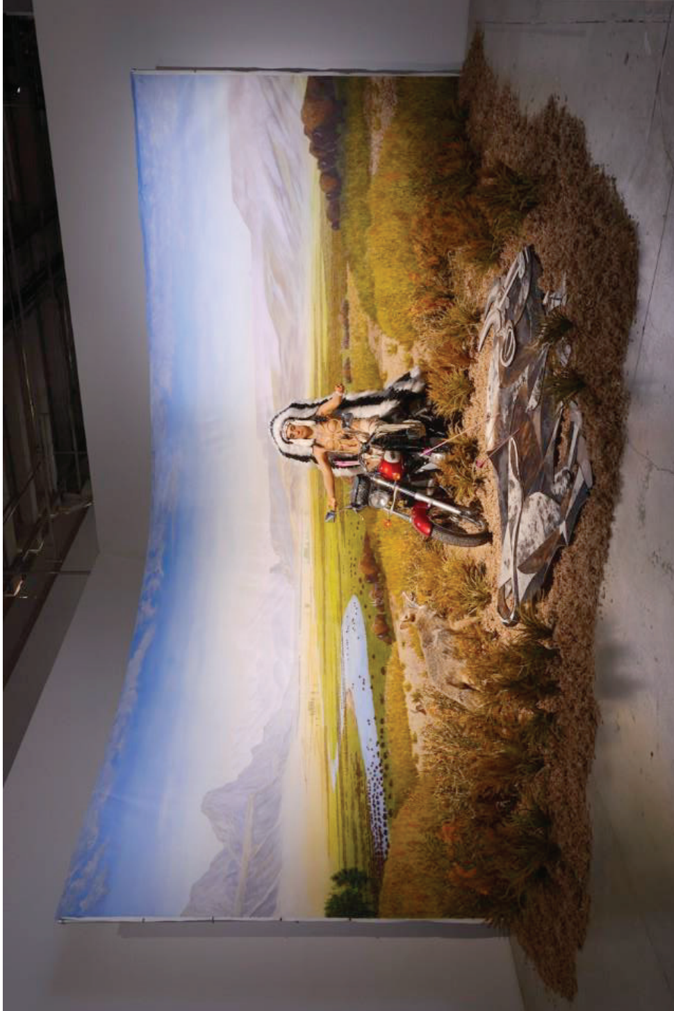
Kent Monkman (1965), Bête noire , 2014, acrylique sur toile, matériaux divers, 487,68 x 487,68 x 304,8 cm, Paris, Palais de Tokyo.