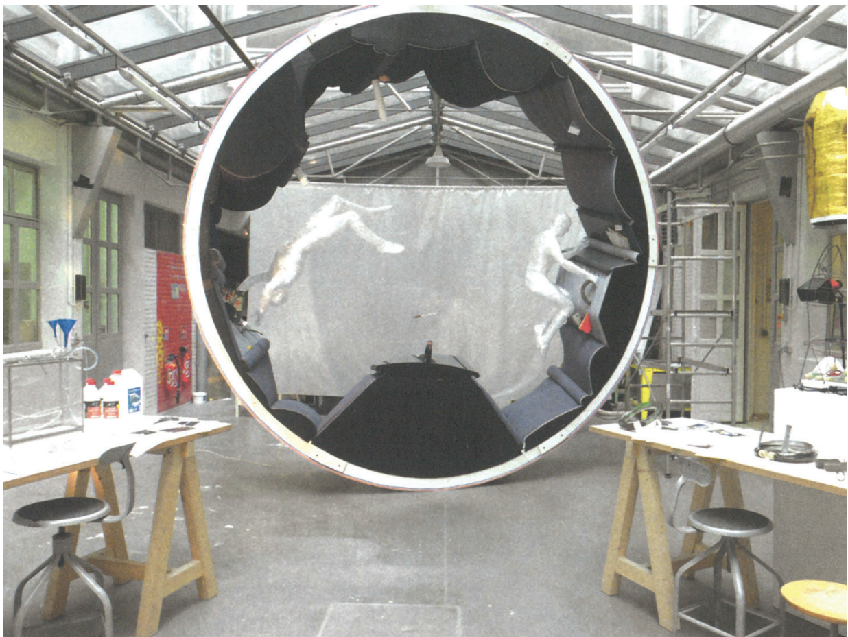
Doc.3 Octave De Gaulle, Distiller 1, 2013

Repenser les gestes et les objets du quotidien en apesanteur : bouteille de vin pour l'espace.